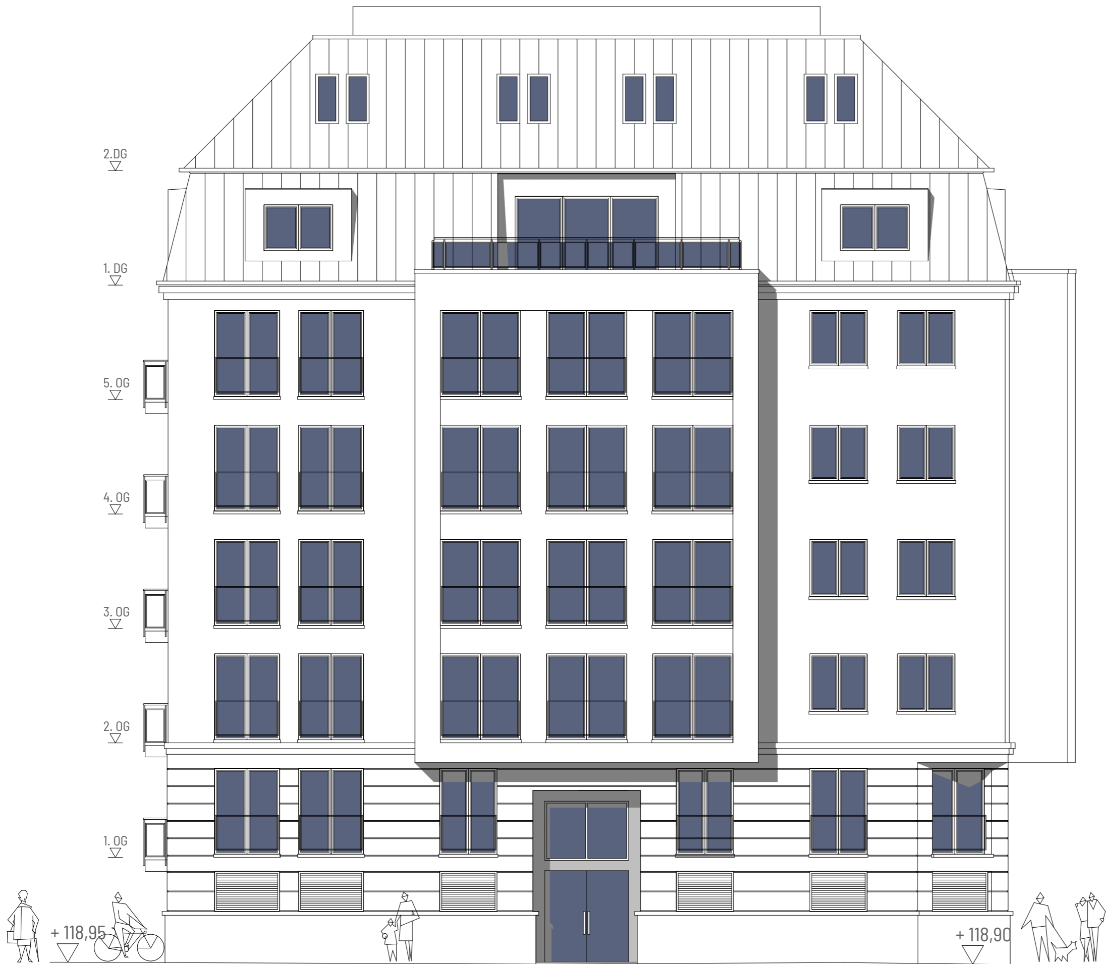
Richard-Lehmann-Str. 47 Ansicht Süd