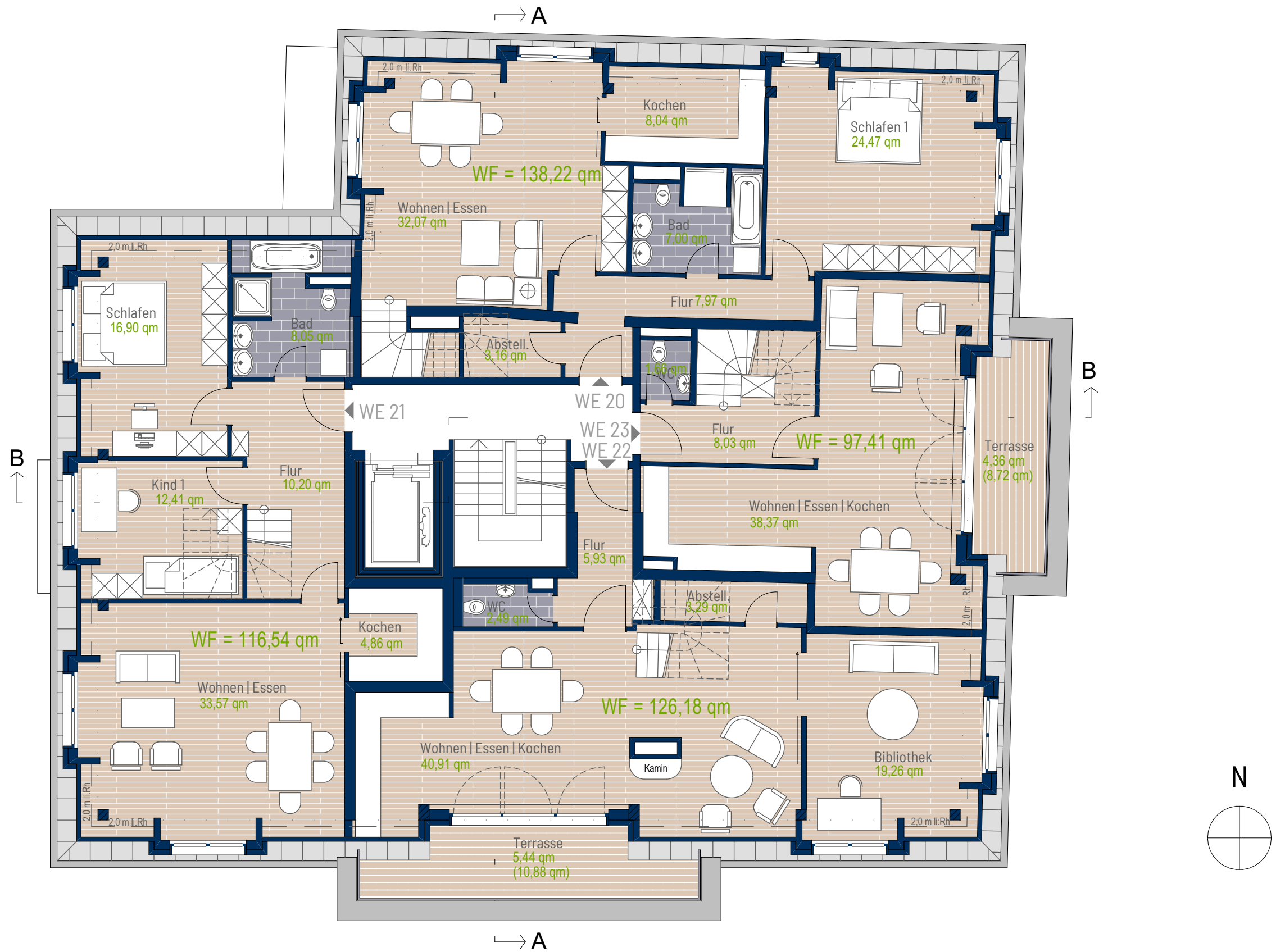
Vertriebsgrundrisse Richard-Lehmann-Str. 47 1. Dachgeschoss