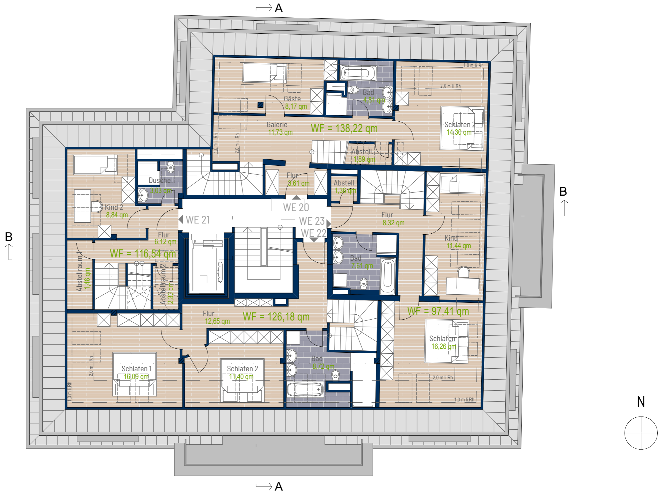
Vertriebsgrundrisse Richard-Lehmann-Str. 47 2. Dachgeschoss